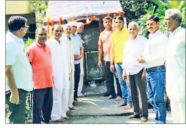
बहादुरगढ़। महर्षि वाल्मीकि को नमन करते ग्रामीण।