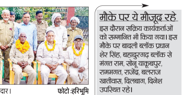
झज्जर। बैठक में उपस्थित ग्रामीण चौकीदार।