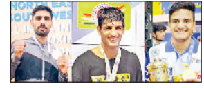
झज्जर। होनहार बॉक्सिंग खिलाड़ी।