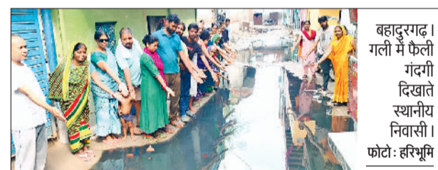
बहादुरगढ़। गली में फैली गंदगी दिखाते स्थानीय निवासी।