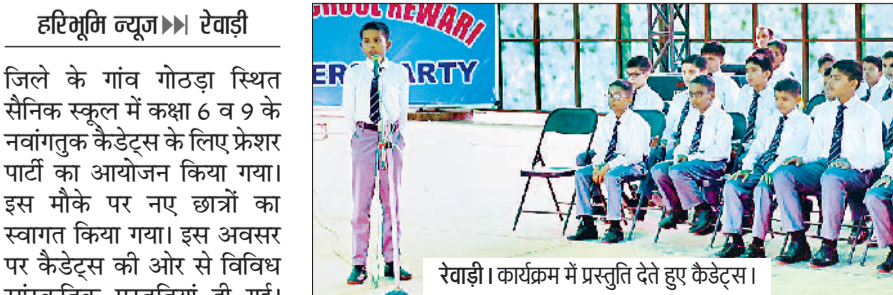
रेवाड़ी। कार्यक्रम में प्रस्तुति देते हुए कैडेट्स।

यह आयोजन नवांगतुक छात्रों और वरिष्ठ छात्रों दोनों के लिए प्रेरणादायक रहा।