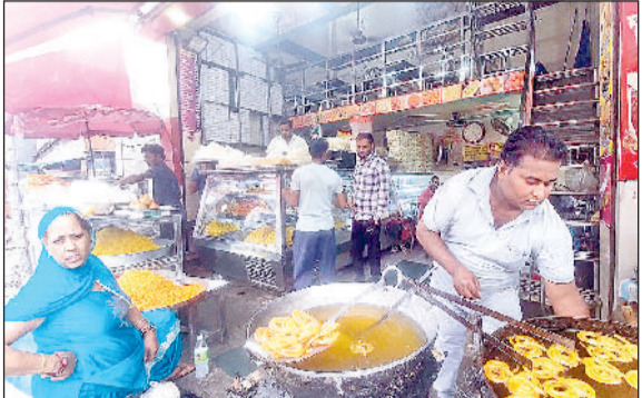
झज्जर। अंबेडकर चौक स्थित मिष्ठान भंडार पर खरीदारी करते हुए लोग, सौंदर्य प्रसाधन की दुकान पर खरीदारी करती महिलाएं।