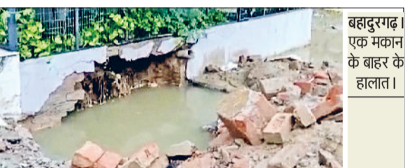
बहादुरगढ़। एक मकान के बाहर के हालात।