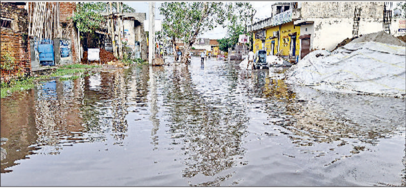
हरिभूमि न्यूज झंझर

बरसात में जलभराव की वजह से यातायात प्रभावित, निकासी के इंतजाम रहे अधूरे