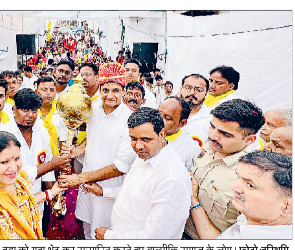
झज्जर। कार्यक्रम के दौरान सांसद दीपेंद्र हुड्डा को गदा भेंट कर सम्मानित करते हुए वाल्मीकि समाज के लोग।

न्यायपालिका को मयगीत करने के प्रयास किए जा रहे