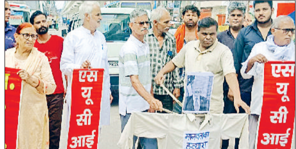
बहादुरगढ़। ट्रंप के विरोध में प्रदर्शन करते संगठन के कार्यकर्ता।

सोशलिस्ट यूनिटी सेंटर ऑफ इंडिया के कार्यकर्ताओं ने फिलिस्तीन के समर्थन में किया प्रदर्शन