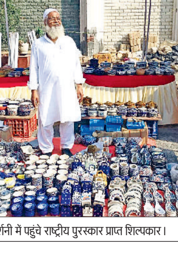
बहादुरगढ़। प्रदर्शनी में पहुंचे राष्ट्रीय पुरस्कार प्राप्त शिल्पकार।